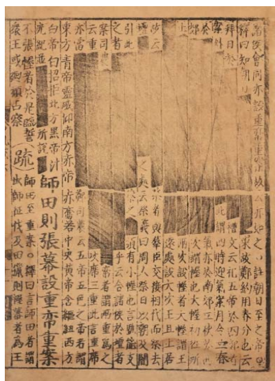
公文書館藏與博古齋上拍同版書影

筆者訂此書為嘉靖萬曆補版，乃以是書所列刻工推論。此書所列刻工，如劉立、曾椿、陸四、王元保、周元美、楊玉、謝元林、陸基郎、葉馬、文昭、楊業等皆未見央館同書，現就已知同刻工所刻之他書列如次：