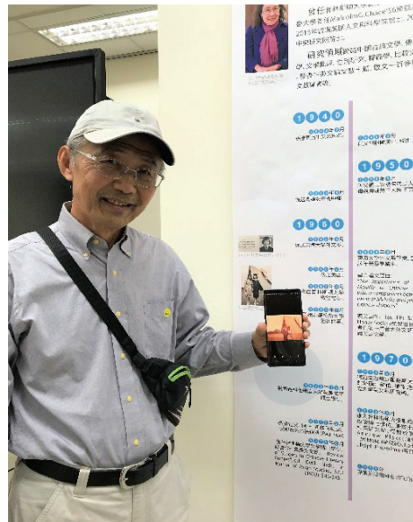
1973 年與夫人同遊東海之紀念照

短暫的觀展之行，孫氏家族終於在疫情之下得以順利親臨現場，並且藉著展覽彼此回顧著親友間的記憶，是如此令人感動！