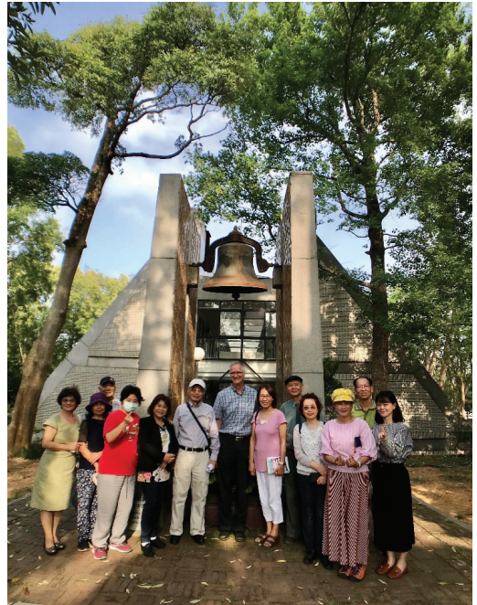
孫氏家族與柯牧師夫婦於畢律斯鐘樓合影